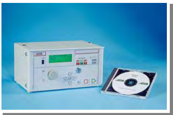
Aparat z oprogramowaniem Winateq umożliwiającym pracę z komputerem.